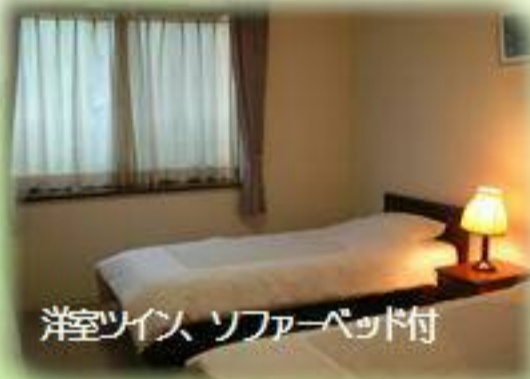
洋ツイン、ソファベッド付

受付は、宮本の湯になります。 館内はセルフサービスとなります。 自炊場やお食事処はございません。 お食事がご希望の方は、裏面の 宮本の湯または秩父ふるさと村の お食事プランをお申込みください。 (事前要予約)